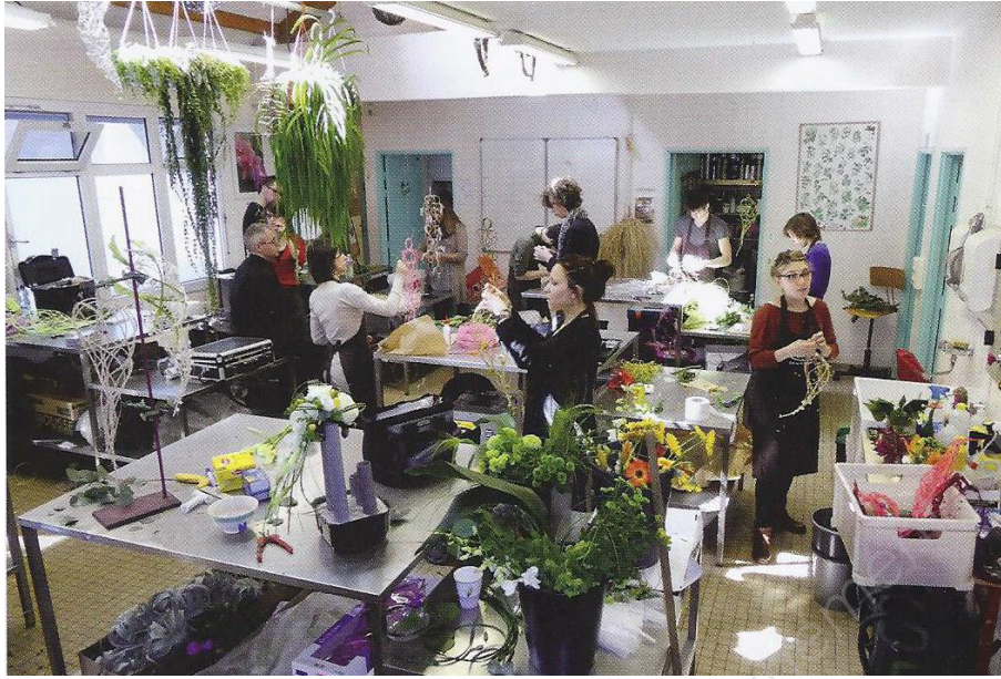
Informations Fleuriste n°278