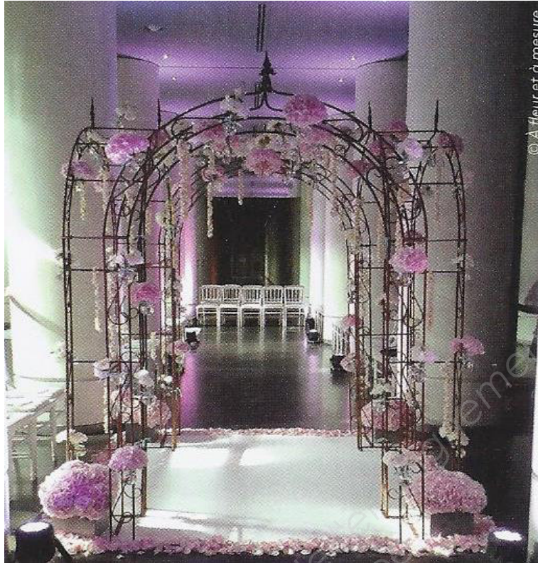
Informations fleuristes n° 276